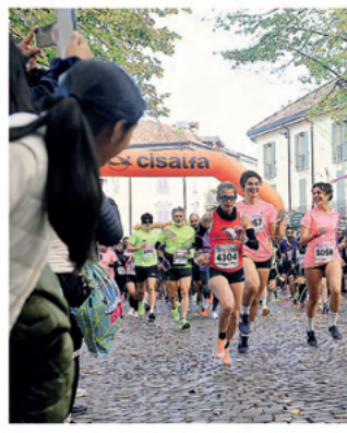
Alcune immagini delle corse e camminatine di Ieri a Lodi che oltre a fare bene alla salute dei partecipanti hanno garantito fondi per iniziative benefiche e per la ricerca scientifica