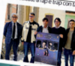
per il terzo anno consecutivo un momento di protagonismo... «Questo evento è importante perché significa un'apertura della piazza per la cultura giovanile».