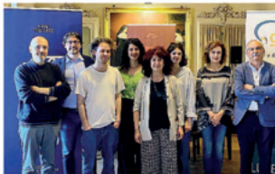
Foto di gruppo con gli organizzatori e gli enti sostenitori di Kàlamos