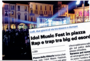
Idol Music Fest in piazza Rap e trap tra big ed esordienti

di Sarah Marchionni Una volta ancora l'Idol Music Festival ha riempito il centro storico di Lodi con la seconda serata del festival. In piazza della Vittoria a Lodi, per il terzo anno consecutivo, si è svolta una serata di musica rap e trap. Tormento, Dani Faiv, Sayf, Quentin40: nomi che ai quarantenni lodigiani diranno poco, ma che per i teenager della provincia valgono quanto i Rolling Stones valevano per i loro genitori. L'Idol Music Festival ha portato per il terzo anno consecutivo il rap e la trap nel cuore di Piazza della Vittoria, trasformando uno dei simboli della città in un palcoscenico per la cultura giovanile.