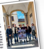
che si esibiranno sabato 10 maggio sul palco della principale piazza cittadina.