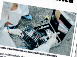
Nel cortile di San Domenico una mostra sulla polizia scientifica

Una mostra per conoscere, immergersi e sperimentare per alcuni minuti l'esperienza e i passaggi vissuti dagli agenti della polizia scientifica nel corso della propria attività di rilievo e di indagine. Verrà inaugurata venerdì e sarà visitabile, gratuitamente dal giorno successivo sino al 26 novembre compreso, l'esposizione denominata "La verità nelle tracce". Oltre 120 anni di polizia di Stato, organizzata dalla polizia scientifica della Lombardia e del Piemonte con il patrocinio della Provincia di Lodi, in collaborazione con Anps Lodi e il sostegno di Bcc Lodi, Zuccheri, Mita, L'Erbolario, Mta, F.lli Lapenna Srl, Fratelli Giacomel, Concommercia, Fondazione comunitaria della Provincia di Lodi e Fa Chemical Logistic. Ad ospitare la mostra, iniziativa rientrante nelle attività promosse nell'ambito del trentennale della questura di Lodi, il cortile San Domenico della Provincia di Lodi. Si tratta di un