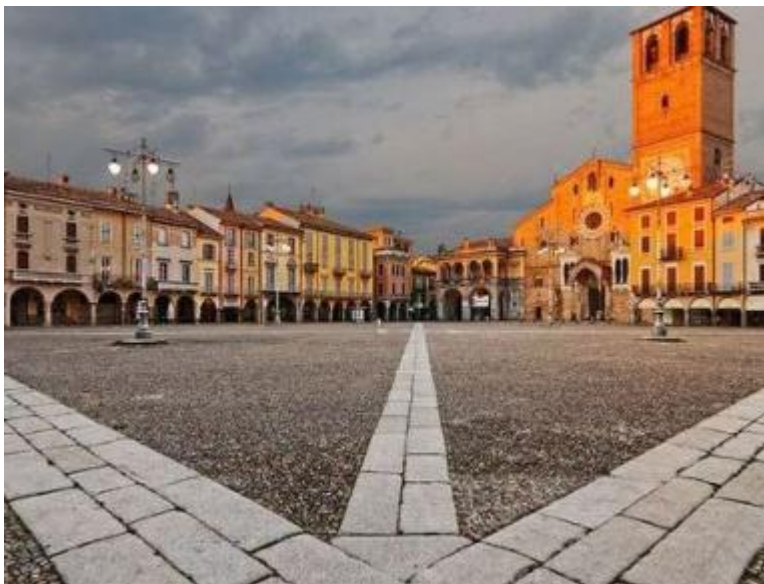
Un'immagine della splendida piazza Vittoria, cuore di Lodi

È da tempo al centro del dibattito sociale e politico del territorio, in particolare per la riflessione sul rapporto tra Lodi e Milano. Bcc Lodi si muove per agevolare la capacità d'attrazione del territorio proponendo una formula vantaggiosa di mutuo prima casa, valida per chi è residente fuori dalla provincia di Lodi ma desidera acquistare o costruire la propria abitazione in uno dei Comuni di competenza Bcc Lodi (Abbadia Cerreto, Bertonico, Boffalora d'Adda, Borghetto, Borgo San Giovanni, Casaletto, Casalmajocco, Casalpusterlengo, Caselle Lurani, Castiraga Vidardo, Cavenago d'Adda, Cornegliano Laudense, Corte Palasio, Crespiatica, Galgagnano, Graffignana, Lodi, Lodi Vecchio, Mairago, Marudo, Masalengo, Montanaso, Ossago, Pieve Fissiraga, Salerano Sul Lambro, San Martino in Strada, Sant'Angelo Lodigiano, Secugnago, Sordio, Tavazzano Con Villavesco, Terranova dei Passe-