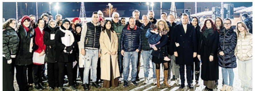
Foto di gruppo per sponsor e gestori della pista di pattinaggio sul ghiaccio Ploiesteanu